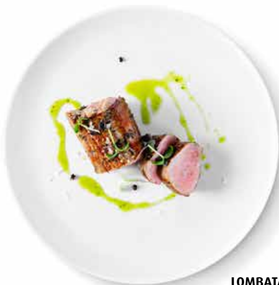
LOMBATA DI MAIALE grilovaná vepřová panenka