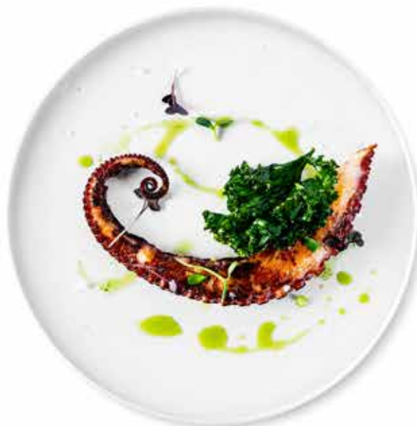
POLPO ALLA GRIGLIA grilovaná chobotnice