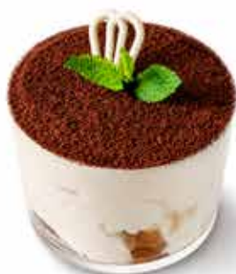
TIRAMISÙ (1,3,7) 119 Kč u nás vyráběná poctivá italská klasika an honest italian classic produced here