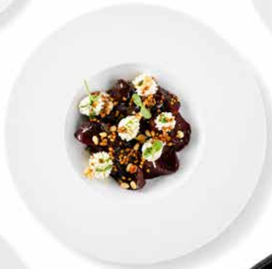
BARBABIETOLA CON MASCARPONE červená řepa, balsamico, med, mascarpone, pohanka, piniové oříšky