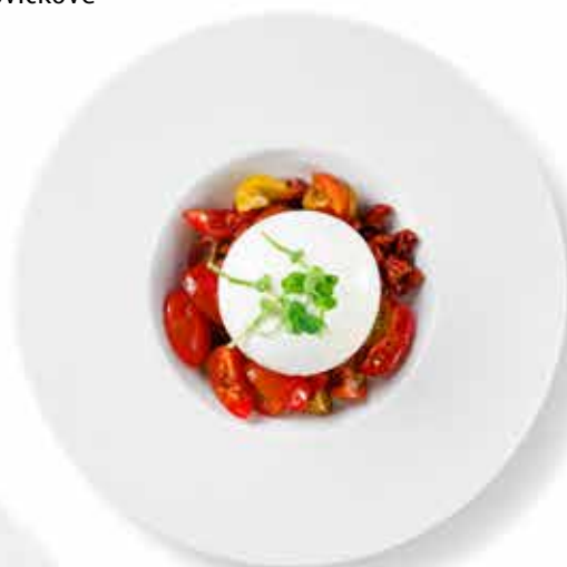
BURRATA CON POMODORINI krémová Burrata, cherry rajčátka, sušená rajčata, extra virgin