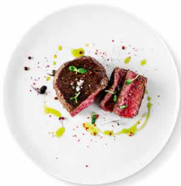
BISTECCA DI FILETTO DI MANZO biftek z hovězí svíčkové