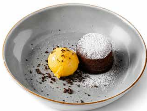
FONDANT AL CIOCCOLATO (1,3,7,8) 149 Kč náš čokoládový fondán s mango-maracujovou zmrzlinou chocolate fondant with mango ice cream