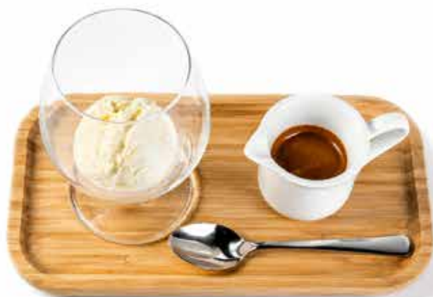
AFFOGATO (7) 89 Kč espresso, vanilková zmrzlina espresso, vanilla ice cream