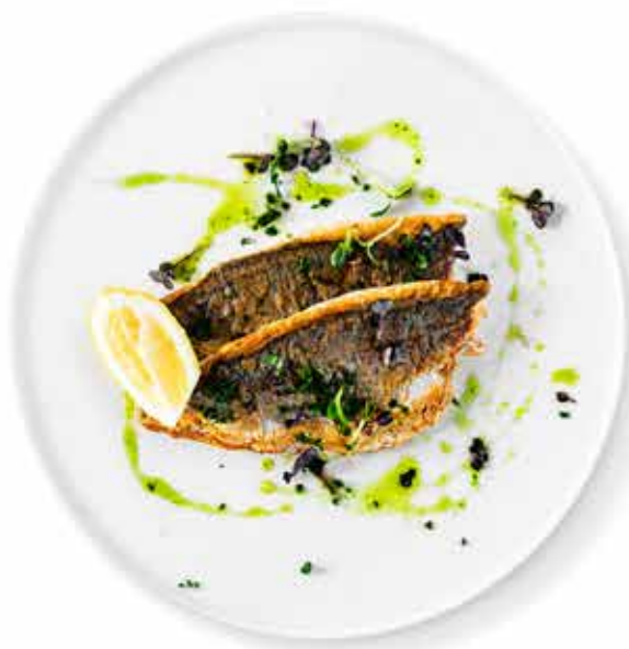
FILETTO DI BRANZINO filet z mořského vlka