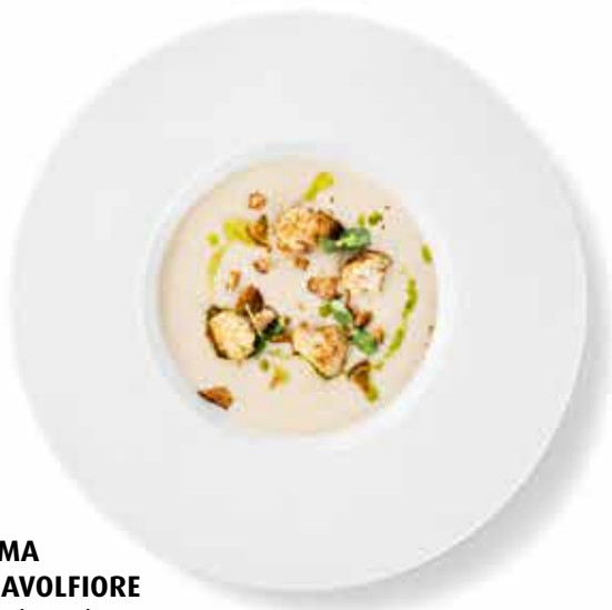
CREMA DI CAVOLFIORE květákový krém topinambur