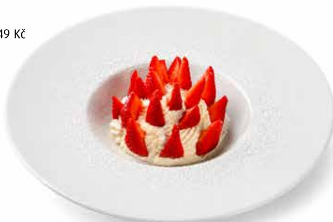
MASCARPONE E FRAGOLE (7) 149 Kč šlehané mascarpone s čerstvými jahodami mascarpone with fresh strawberries