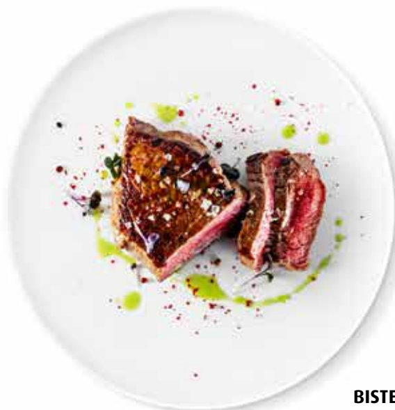
BISTECCA DI SCAMONE DI MANZO filírovaný hovězí rump steak