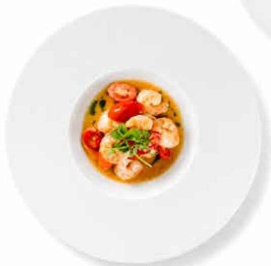
GAMBERETTI CON AIOLI restované krevety s česnekem, feferonkami, aioli omáčka