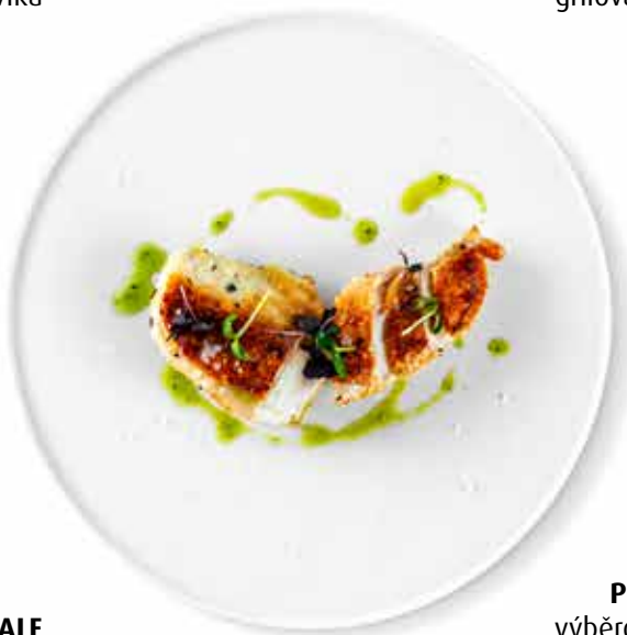
PETTO DI POLLO výběrové kuřecí prso s křupavou kůží