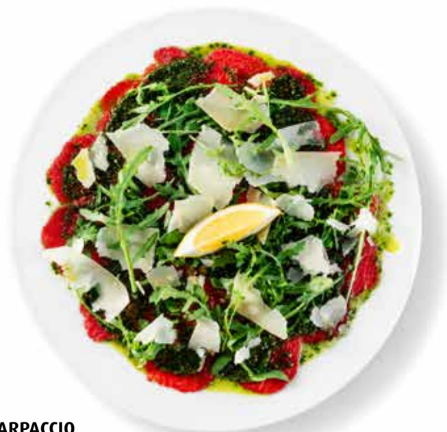
CARPACCIO DI FILETTO DI MANZO carpaccio z hovězí svíčkové