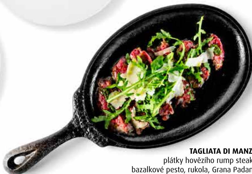
TAGLIATA DI MANZO plátky hovězího rump steaku bazalkové pesto, rukola, Grana Padano